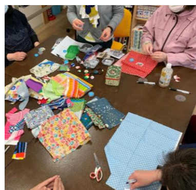
第1回アート&クラフト「くるみボタンを作ろう!」の様子

これからも「令和」の時代にちなみ、ひとりひとりの感性がひびきあい調和するこかげを目指していきましょう!(羽毛田)